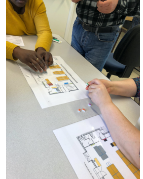
Maquetage sur plan en groupe de travail